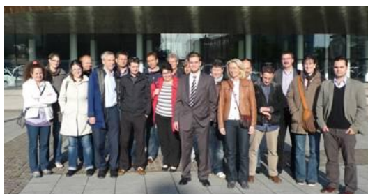
Les partenaires du projet devant le Millennium Center de Cardiff (UK)

Lors des deux derniers jours de la rencontre ont lieu des conférences sur la biologie, les intrants, les digestats, l'injection du biogaz, les paramètres de gestion des unités.... Un résumé de ces conférences est disponible sur notre site internet. Lien